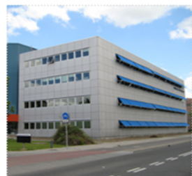
Realisatie door CIT - Applicatieontwikkeling